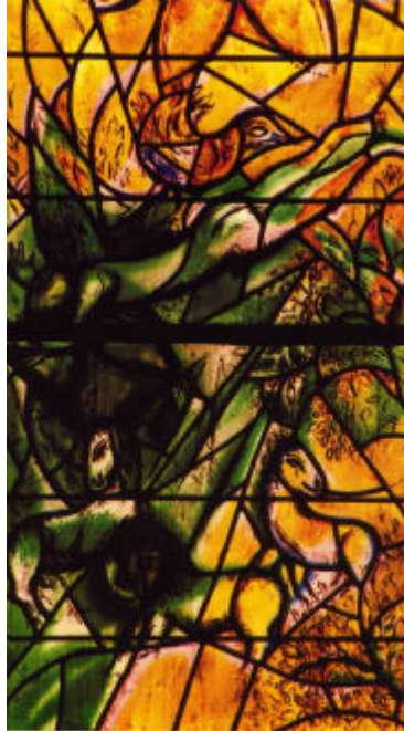
Cathédrale St Etienne Marc CHAGALL

2, 3, 4 décembre 2005 METZ F-57000 3 ème congrès francophone